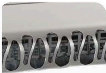
CUPULA PROTECTORA INOXIDABLE EXCLUSIVA SAYL